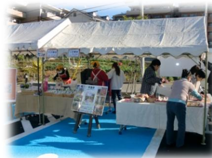
地域の障がい施設焼き菓子販売 →