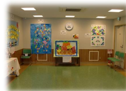
← デイサービス作品展示会