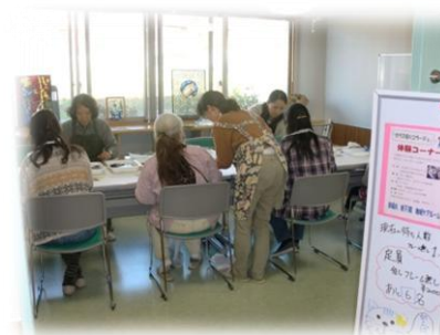
← 行バス朝のワークショップ体験教室