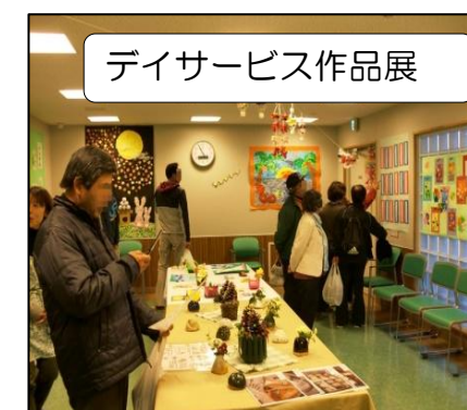
デイサービス作品展