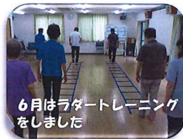
6月はラダートレーニングをしました

こんにちは。あなたの街の生活支援コーディネーター森田です★ 住み慣れた地域で元気に暮らしていくことは誰もが願うことですね。 そんな願いに一步近づくための情報をお届けしたいと思います。 今回は中川地区社会福祉協議会が行っている『健康体操教室』に お邪魔してきたので、ご紹介します。 泉スポーツセンターから講師の先生を招き、 しっかりと身体を動かすプログラム を行い 健康づくりに励んでいます。ストレッチからリズムに合わせたステップ運動♪ そして脳トレを兼ねた体操は毎回異なる内容で、飽きることなく楽しんで参加できます。