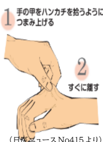
(日経ニュースNo415より)