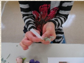
①花材をワイヤリング

ソーシャルディスタンスを保ち、2方向換気等の感染症対策を行いながらの開催でした。もの作りの好きな方たちが集まり、楽しそうに作っていらっしゃいました。