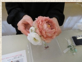
②出来上がりをイメージして配置してみる