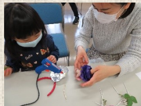
③グルーガンでしっかりとめる