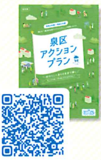
泉区アクションプランの詳細はこちら(泉区役所HP)

そんな「できるときに、できることを、できる人が行う」地域の支え合い活動に興味を持たれた方! 有償ボランティアに参加してたくさんの方の笑顔に出会いませんか!! 「参加してみたい」「もっと活動のことを知りたい」などありましたら、ケアプラザの森田までお気軽に声を掛けて下さいね。