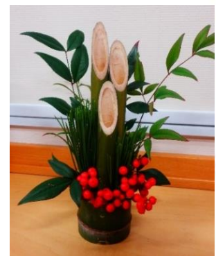
↑三二門松の 作品イメージ