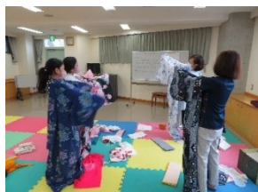
半幅帯で蝶結びをし、一人で浴衣を着れました！