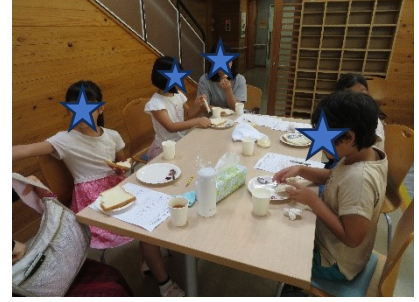
出来たバターをみんなで試食！