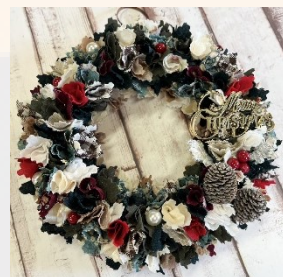
見本は受付にあります

申込み：10月28日（土）午前10時より来館・電話にて受け付けます。定員になり次第締め切ります。ご了承ください。