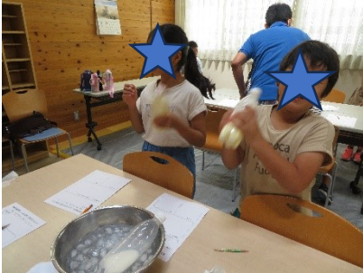
シャカシャカペットボトルを振る

8月20日（日）夏休み実験教室を開催しました。生クリームをペットボトルの容器に入れ、シャカシャカ振り、サラサラだった液体が、どのように変化していき、バターになるのか観察しました。どれくらいバターが出来たか計り、自分の作ったバターをパンに塗って試食しました。