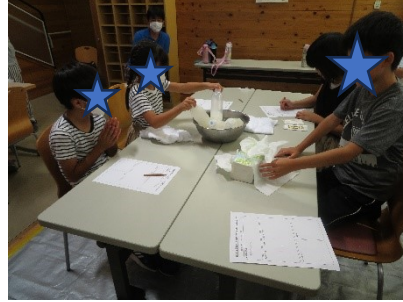
出来たバターを計ってみる