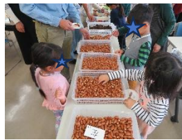
たくさんのどんぐりから選んでいる様子