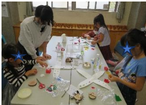
クラフトパンチで型を抜きセロファンを貼っている様子

キャンドルホルダー作りでは、牛乳パックをきれいに洗い、パッケージをはがしたものに、色々なクラフトパンチで型を抜き、セロファンをはって仕上げました。作ったキャンドルホルダーは、12月1日、2日に開催する『上倉田キャンドルナイト』で展示されます。