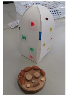
どんぐり工作とキャンドルホルダーの完成！！