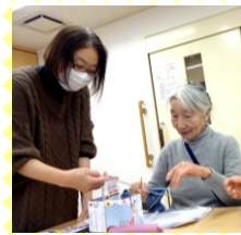
下倉田地区社会福祉協議会 下倉田地域ケアプラザ 共催事業