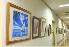
↑ 2月の展示 サップグリーンさんです。