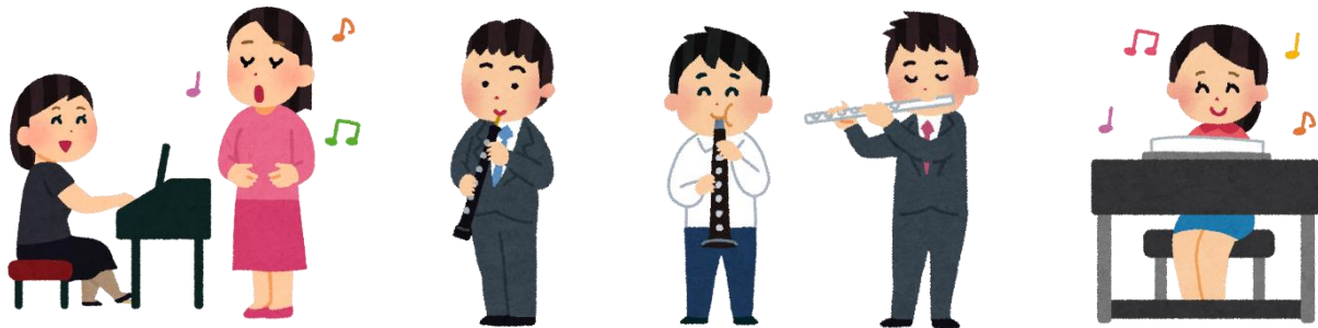
5月の予定表 詳しくはお問い合わせください。

6月8日（土）から毎月第2土曜日午後2時～3時、交流ラウンジにある電子ピアノを自由に弾いていただけます。ピアノのみでの演奏はもちろんのこと、ピアノ+歌、ピアノ+木管楽器などピアノ+1までと一緒に演奏していただけます（但し、金管楽器やエレキギター、ドラム等大きな音が出る楽器は除きます）。ピアノの演奏をしてみたいという方、是非ご来館ください！ピアノの演奏を聴きに来たい方も大歓迎です。詳しくは受付までお問い合わせください。