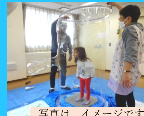
写真は、イメージです

親子(0~未就学児)が集まって 自由にお話したり、遊んだりする 出入り自由のフリースペースです。 今回は、しゃぼん玉が上手な スーパーボランティアさんが 来てくれますよ。