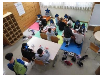
上倉田地域ケアプラザ開催